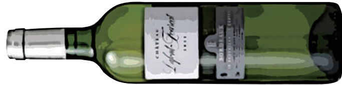
Chateau Lafont Fourcat Blanc シャトー・ラフォン・フルカ [ FRANCE ] 900 ボルドー古代品種「ミユスカデル」というブドウを100%使用。 フルーティーさが特徴で、凝縮感ある上品な味わいを楽しませてくれます。