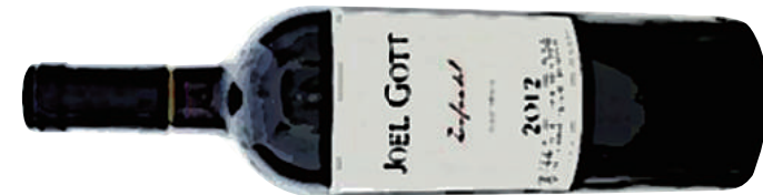
Joel Gott Zinfandel ジョエル ゴット ジンファンデル [ CALIFORNIA ] 1300 冷涼地と温暖なエリアのブドウをブレンドすることで、豊かな果実味と 引き締まった風味が共存するスタイルに仕上がっている。