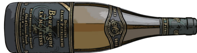
Alan Payriarche Bourgogne Chardonnay アラン パトリアルシェ ブルゴーニュ [ FRANCE ] 1200 ゆり等の白い花を思わせるフレーヴァーがあり、 青りんごの果実味が感じられます。バランスが取れている辛口白ワイン。