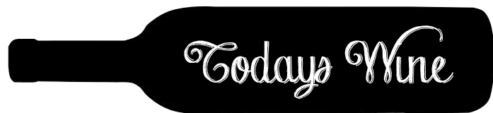
Today's Wine ASK 本日の白、赤ワイン（詳細はスタッフにお尋ねください。）