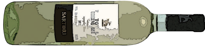
Pinot Grigio Organic ピノ・グリージョ オーガニック [ ITALY ] 700 イタリアでオーガニックワインの認定を受けたピノ・グリージョ種のワイン。 柔らかい口当たりと余韻に感じる心地良い苦味が魅力です。