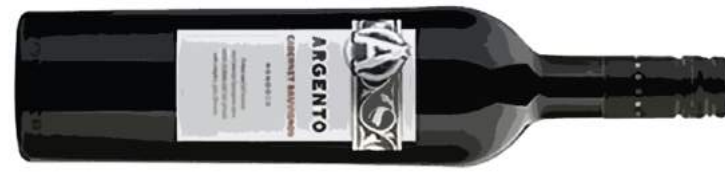
Argento Cabernet Sauvignon アルジェント カベルネ・ソーヴィニヨン [ ARGENTINA ] 1100 ジョーロッパNo.1アルゼンチンワイナリーのなめらかカベルネ。 樽熟成によるトリュフやカシスのニュアンスも広がり、力強い余韻がしっかりと長く感じられます。