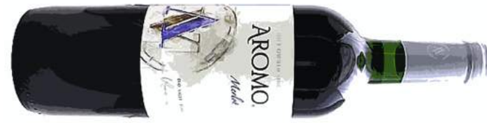
Aromo Merlot アロモ メルロー [ CHILE ] 700 チリ・マウレ・ヴァレーの理想的な環境で育ったブドウの恵みを 十分堪能できる辛口の赤ワインに仕上がっています。